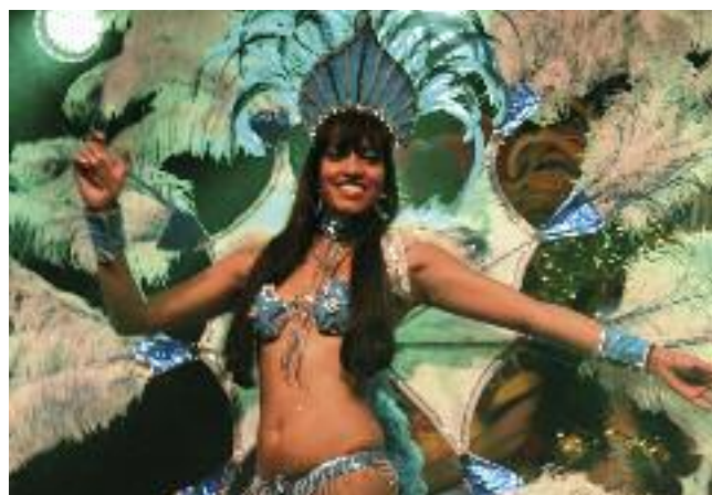
Danse brésilienne : une envie de vacances...