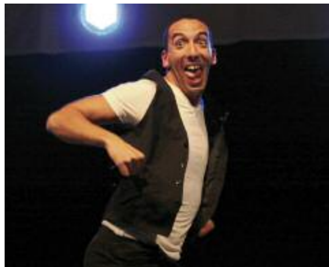
Farid : l'art et la manière d'emballer son public