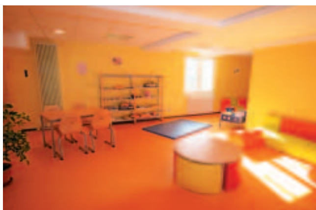
Des espaces pour le périscolaire

Le deuxième élément, charge moyenne pour la collectivité par enfant, sachant que le centre est fréquenté actuellement par 35 enfants ; c'est une participation de 2 000 €/enfant/an pour la collectivité.